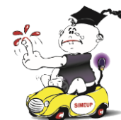
Società Italiana di Medicina di Emergenza e Urgenza Pediatrica